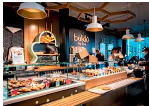
Por M. A. Boldú ha abierto un local de 205 metros cuadrados en la Terminal 1.

el centro de Barcelona, además de un servicio de catering personalizado, de forma que es la primera vez que esta firma familiar, con una trayectoria de más de 75 años, sale fuera de la capital catalana. La apertura se enmarca dentro de la adjudicación a Áreas de la explotación de 15 nuevos establecimientos en el Aeropuerto de Barcelona por parte de Aena, que servirán para renovar la oferta de restauración existente en El Prat.