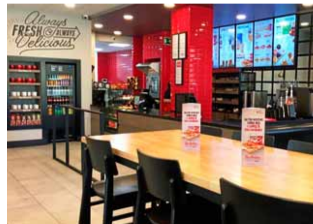
Por M. A. Las cafeterías de Tim Hortons hornean la bollería en el propio local.

su primera cafetería para el mercado europeo en Madrid hace nueve meses y ya cuenta con doce establecimientos en la capital española. Cuando Tim Hortons abrió su primer local en España, el presidente de expansión internacional del grupo, Elías Díaz Sesé, afirmó que su mejor estrategia era el café “de mucha calidad” a precios “muy competitivos”. El objetivo de la cadena es extenderse por el mercado español a la mayor velocidad posible.