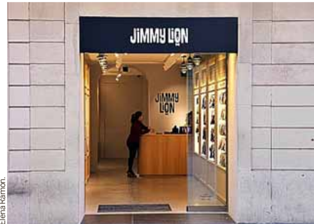
Jimmy Lion ha abierto en el número 7 del Portal de l'Àngel.