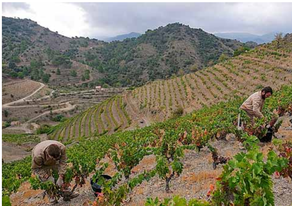
FAMILIA TORRES CULMINA EN EL PRIORAT LA VENDIMIA DE 2019

El grupo vinícola Familia Torres ha finalizado esta semana la vendimia. El viñedo Mas de la Rosa (en la foto), situado en Porrera (Priorat), ha sido la última finca que se ha cosechado, totalmente a mano, en las empinadas laderas donde crecen unas vides de más de 80 años de Carifena y Garnacha. También han sido las últimas en vendimiarse las variedades ancestrales prefloréticas Moneu y Forcada, plantadas en el Penedès y con gran potencial para afrontar el cambio climático. Torres empezó la vendimia el 26 de agosto y considera que ha sido "de muy buena calidad", a pesar de que el rendimiento global de los viñedos ha caído un 20% por la falta de lluvias.