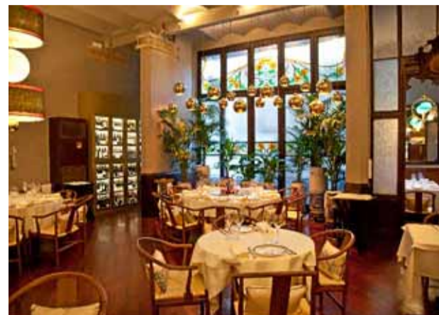
El antiguo Casa Calvet, convertido en China Crown.